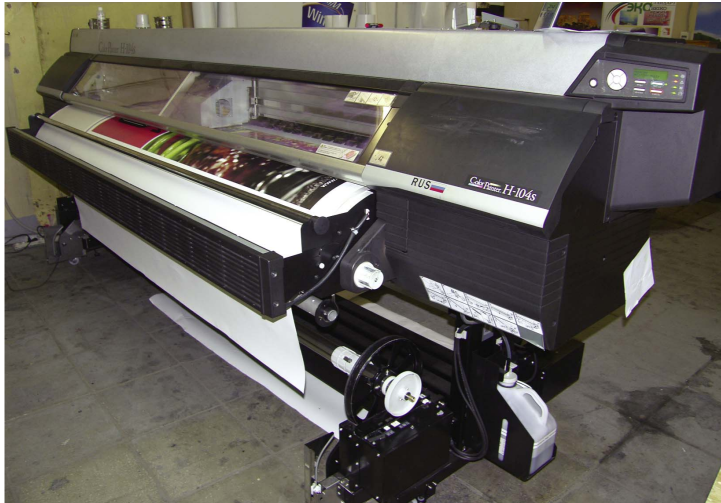
Тест-драйв принтера Seiko ColorPainter H-104s на производстве компании «Мир Рекламы»